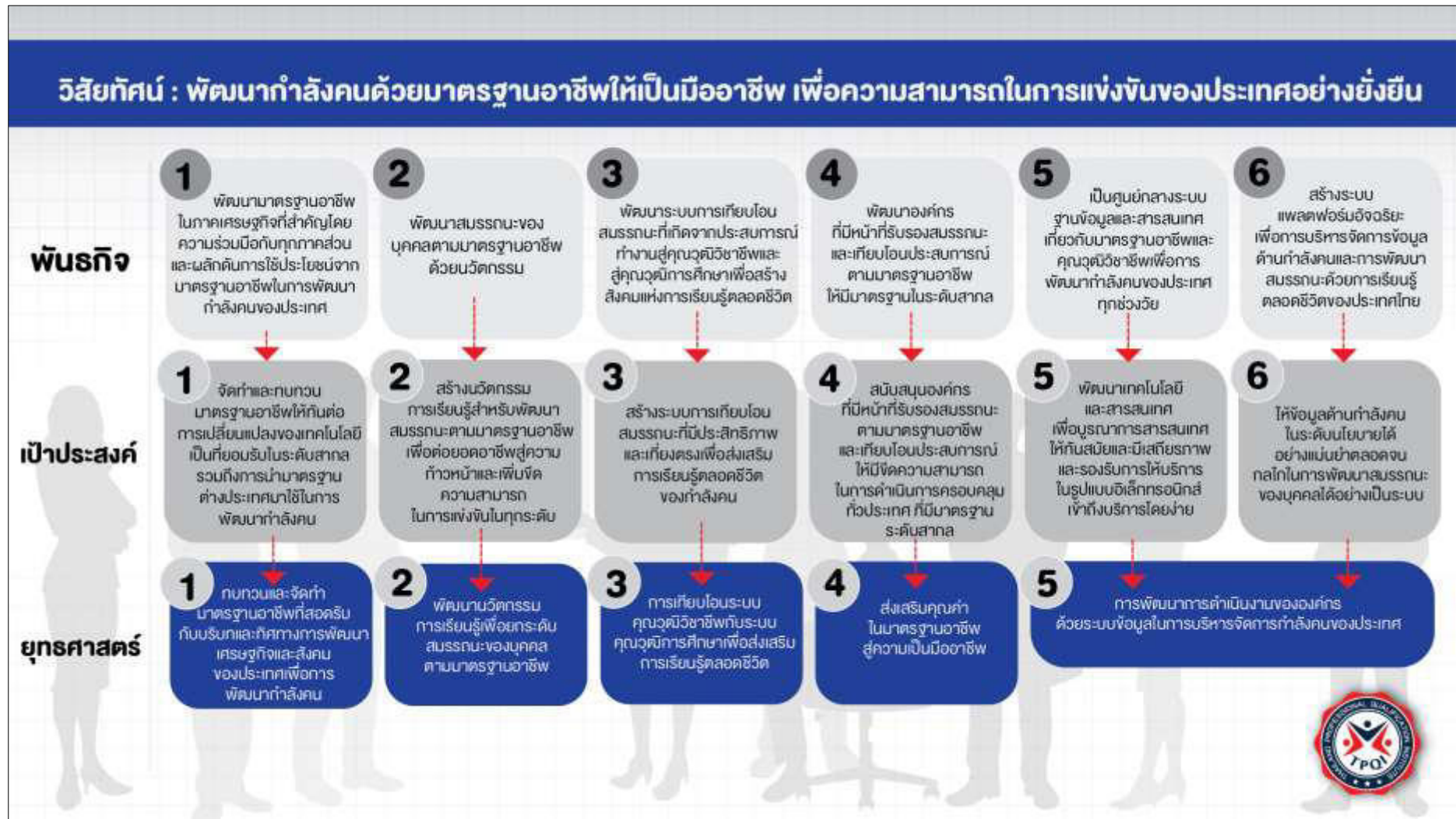
แผนภาพ ความสอดคล้องระหว่างวิสัยทัศน์ พันธกิจ เป้าประสงค์ และยุทธศาสตร์สถาบันคุณวุฒิวิชาชีพ พ.ศ. 2565 – 2570