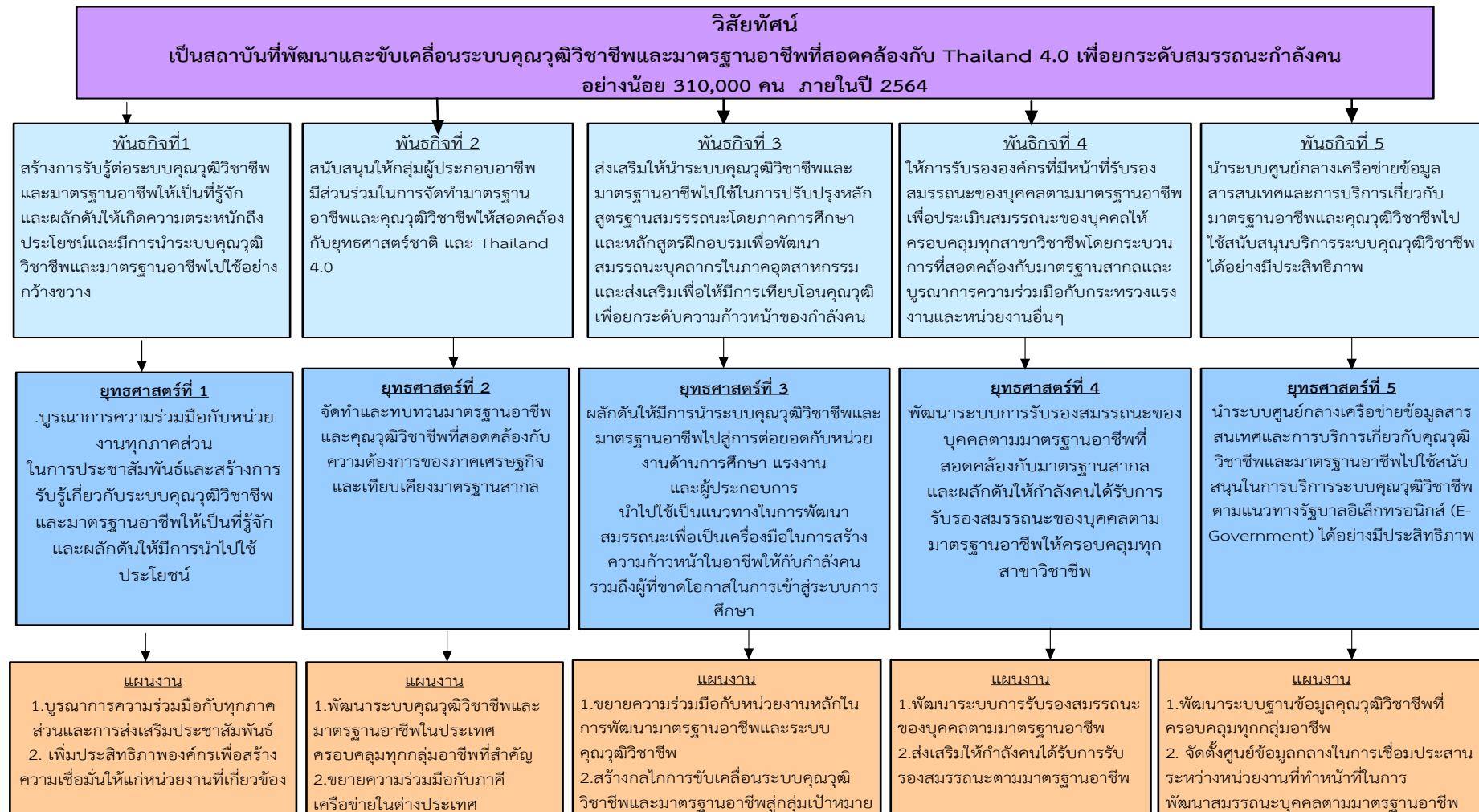
แผนภาพที่ 5.1 ความสอดคล้องระหว่างวิสัยทัศน์ พันธกิจ วัตถุประสงค์หลัก ยุทธศาสตร์ และแผนงานของแผนยุทธศาสตร์สถาบันคุณวุฒิวิชาชีพ พ.ศ. 2560 - 2564