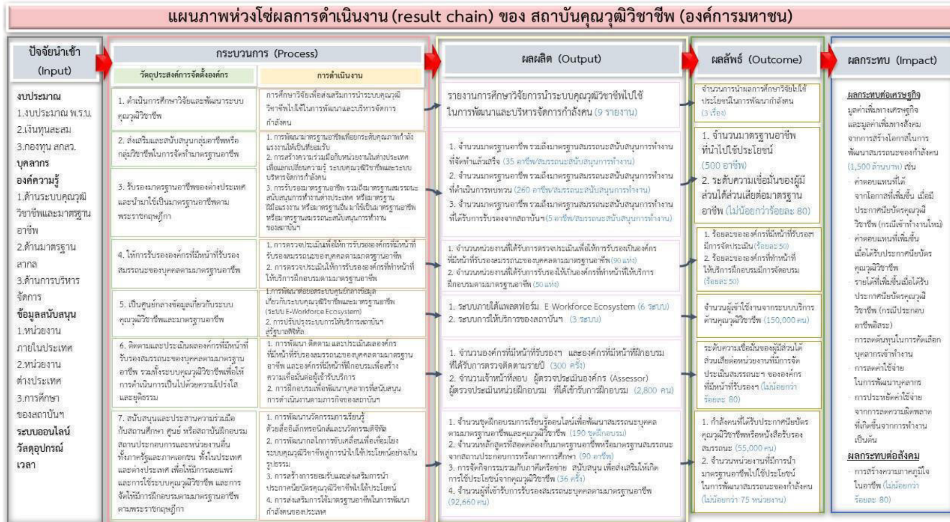
ภาพที่ 1 แผนภาพห่วงโซ่ผลการดำเนินงาน (Result Chain) ของสถาบันคุณวุฒิวิชาชีพ (องค์การมหาชน)