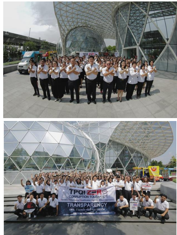
ภาพที่ 2 กิจกรรมประกาศเจตจำนงต่อต้านการทุจริตของ สคช. ประจำปีงบประมาณ พ.ศ. 2562 ในวันที่ 2 เมษายน 2562 ณ ลาน หน้าตึกเพิร์ล โดยมีคณะผู้บริหาร เจ้าหน้าที่ เข้าร่วม ซึ่งเป็นกร แสดงถึงความมุ่งมั่นในการดำเนินงานตามหลักธรรมาภิบาล