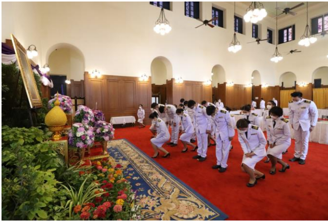
ภาพที่ 1 คณะผู้บริหารสถาบันฯ ร่วมถวายแจกันดอกไม้ พร้อมลงนามถวายพระพร สมเด็จพระกนิษฐาธิราชเจ้า กรมสมเด็จพระเทพรัตนราชสุดาฯ สยามบรมราชกุมารี เนื่องในวันคล้ายวันพระราชสมภพ เป็นการแสดงออกถึงความจงรักภักดีต่อสถาบัน ชาติ ศาสนา พระมหากษัตริย์