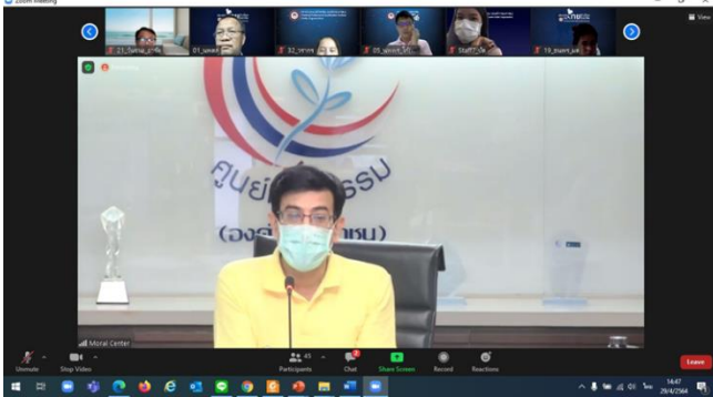
ภาพที่ 2 จัดอบรมเชิงปฏิบัติการ “กระบวนการพัฒนาองค์กรด้วยมาตรฐานด้านคุณธรรม” ร่วมกับศูนย์คุณธรรม (องค์การมหาชน) เมื่อวันที่ 28 - 29 เมษายน 2564 อบรมในรูปแบบ Online ผ่านระบบ Zoom meeting โดยมีผู้บริหารและเจ้าหน้าที่เข้าร่วมจำนวน 40 คน